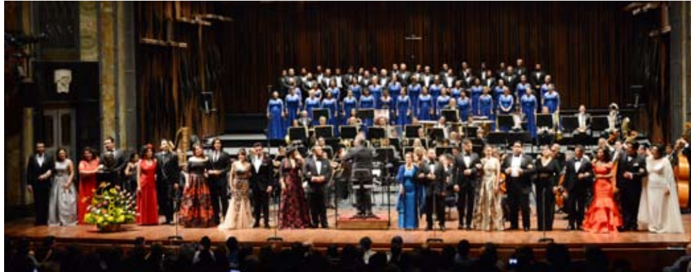
Los participantes de la Gala Morelli 35