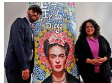
Nilo Cruz y Gabriela Lena Frank, en Bellas Artes

El pasado 24 de agosto se anunció en la Sala Manuel M. Ponce del Palacio de Bellas Artes el proyecto para producir y estrenar en 2020 la ópera en español El último sueño de Frida y Diego del libretista cubano Nilo Cruz (ganador del Premio Pulitzer) y la compositora peruano-estadounidense Gabriela Lena Frank (ganadora de un Grammy Latino), sobre la vida y el legado artístico de Frida Kahlo y Diego Rivera. El proyecto es una coproducción de la Ópera de Fort Worth y la Ópera de San Diego con el Colegio de Bellas Artes de la Universidad de Texas en Austin y la Universidad DePauw de Indiana.