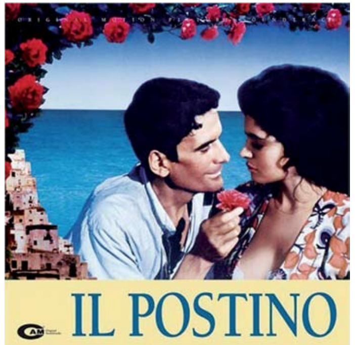
Il Postino , el nuevo proyecto

Me interesa mucho que mis obras se conozcan en México, pero no he corrido con suerte. Montar obras nuevas requiere de mucha planificación y organización. Y ese ha sido el problema con nuestras