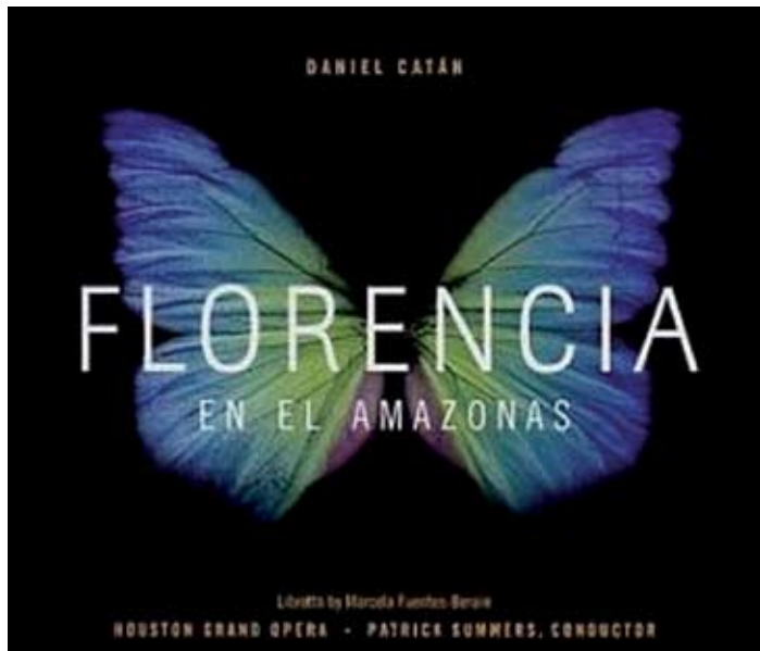
Florencia en el Amazonas , un pasaje de Gabriel García Márquez

Hay varias razones. La ópera contemporánea es compleja y el público no la conoce bien. Los compositores no tienen la experiencia que se adquiere después de haber compuesto y montado sus primeros intentos. Mira la historia y verás que aun los compositores más dotados tuvieron dos o tres óperas fallidas antes de dominar el oficio. Es difícil hoy en día adquirir esa experiencia. Súmale a esa situación representaciones mediocres y ahí tienes las razones por las cuales la ópera contemporánea rara vez logra conquistar al público.