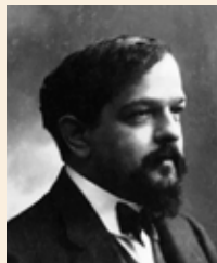
Claude Debussy (1862-1918)

Aniversario luctuoso de Claude Debussy (25 de marzo de 1918)