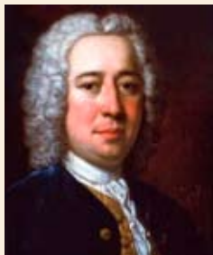
Nicola Porpora (1686-1768)

Aniversario luctuoso de Nicola Porpora (3 de marzo de 1768)