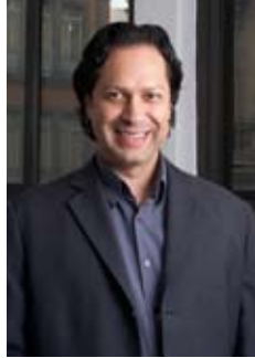
Alonso Escalante Mendiola regresa como director de la Ópera de Bellas Artes

Alonso Escalante Mendiola es el nuevo Director Artístico de la Ópera de Bellas Artes, cargo al que llegó a partir del 15 de enero, en sustitución de la soprano Lourdes Ambriz , según informó el Instituto Nacional de Bellas Artes a través de su boletín número 16, fechado el 10 de enero de 2018 en la Ciudad de México.