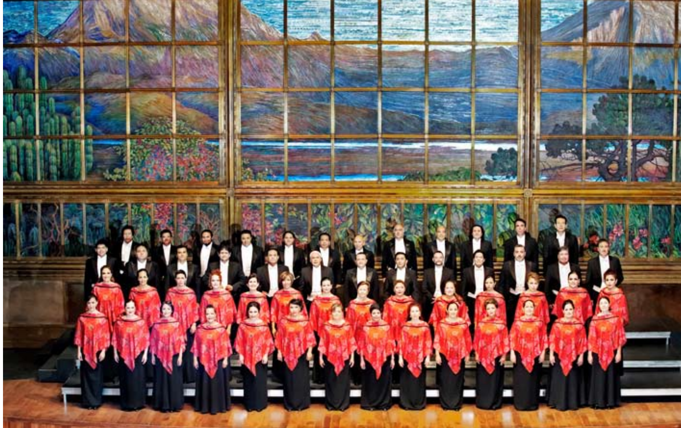
El Coro del Teatro de Bellas Artes ofreció un concierto en marzo