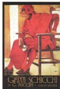
Cartel del estreno de Gianni Schicchi en Milán