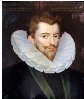
Henri de Guise (1550-1588)

La mujer juega un papel preponderante en el devenir de los libretos de los compositores mexicanos. Catalina goza de las más bellas melodías, de duetos conmovedores, de cadencias y notas rápidas. Paniagua la convierte en un personaje entrañable para el público, pero la historia la castiga por su condición de mujer casada. Durante una noche en vela, Catalina canta una bella aria, rogando a Dios que el Conde no venga y que encuentre el horror que le espera.