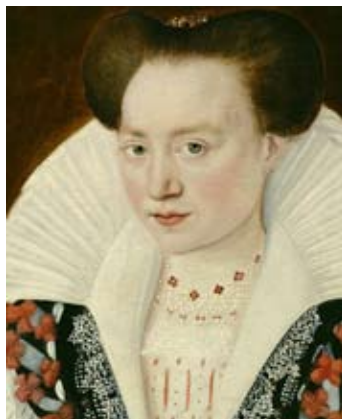
Catalina de Clèves, duquesa de Guisa (1548-1633)

Ésta es una historia de amor malhadada, contada en italiano. Catalina de Cleves (Caterina di Cleves), católica y casada con el duque Enrique de Guisa (Duca Enrico di Guisa), ama en silencio al Conde de San Megrino, pero su amor es imposible. El drama se desata cuando el Duque encuentra el pañuelo de su esposa tirado en el suelo, en el lugar donde ella y San Merino tuvieron antes una conversación. A la manera de Otello, estalla en furia y obliga a la duquesa a escribir una misiva de falso amor para engañar al Conde, aprestándolo a reunirse con ella en sus aposentos, para asesinarlo. Esta misiva es llevada por Arturo, primo de Catalina, escudero y joven confidente de buenas intenciones. Enamorado de nuestra desafortunada heroína, Arturo inicia el segundo acto cantando un recitativo que cuenta cómo fue que desde niño, y habiendo crecido en el Palacio al lado de Catalina, su amor por ella ha crecido, sabiendo que no será nunca de él. Arturo duda en llevar la carta, pero Catalina le ruega hacerlo y, al cumplir su cometido, Arturo promete autodesterrarse por el mal hecho al Conde y por el amor mal correspondido que siente por Catalina.