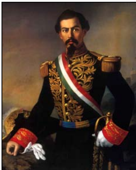
Miguel Miramón (1832-1867)