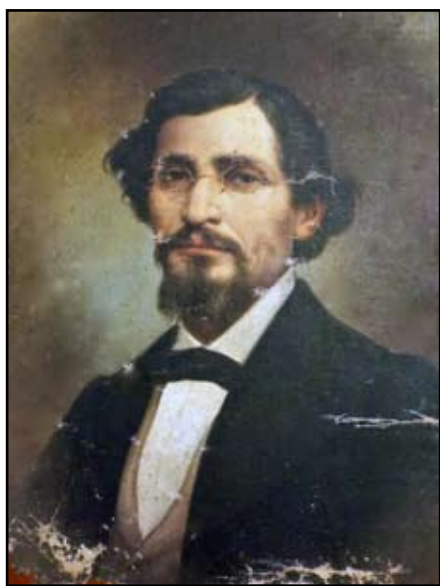
Cenobio Paniagua (1821-1882)

Estos compositores mexicanos, ya desde algunos años antes, habían adoptado el bel canto como recurso expresivo y herramienta compositiva para desarrollar un arte lírico que comenzó a proliferar en la escena a partir del estreno de Catalina de Guisa , de Cenobio Paniagua, en 1859.