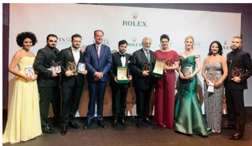
Plácido Domingo, flanqueado por los ganadores de Operalia 2018

Una característica exclusiva de este concurso internacional, el premio de zarzuela Pepita Embil fue para Emily D'Angelo, y el