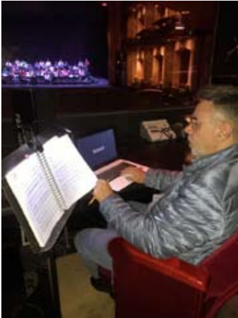
En acción, desde la cabina de supertitulado

“Yo nunca hago deliberadamente una adaptación del lenguaje o un cambio en las palabras o en el argumento, salvo que sea a petición del director de escena”