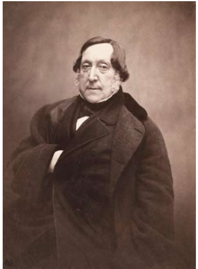
Gioachino Rossini (Pésaro, 1792 – Passy, 1868)

Estas notables características, rara vez difundidas, coexistían en una mente ágil, muy observadora, quisquillosa, que padecía trastornos obsesivos, depresivos, de ansiedad y del sueño, en un individuo que tuvo que enfrentar la hemorragia y, mucho peor, los dolorosos y humillantes métodos de intentos de cura, que lo incapacitaban brutalmente. Las vicisitudes de la vida de Rossini no