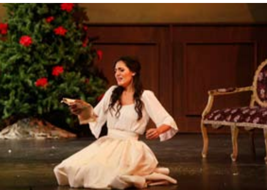
Charlotte en Werther en Monterrey