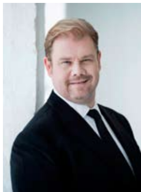
Stuart Skelton

Stuart Skelton es uno de los grandes tenores heroicos de la actualidad. Este cantante australiano se ha especializado en repertorio wagneriano, el cual interpreta con una bella voz abaritonada, elegancia, perfecta dicción en alemán y sin gritar en ningún momento. Canta Wagner sin esfuerzo alguno, matizando y emitiendo un fraseo limpio, sin perder la fuerza dramática o la intensidad vocal. La crítica internacional lo ha nombrado como el mejor Peter Grimes de la actualidad y como un Siegmund que recuerda al gran tenor James King.