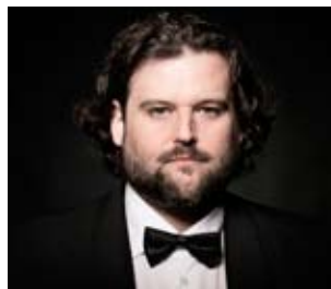
Jean-François Borrás

Este joven tenor francés posee una de las voces más claras y bellas de la escena operística actual. Recuerda mucho a la de su compatriota Alain Vanzo, quien fue uno de los grandes exponentes de la ópera francesa en los años 50 y 60 del siglo pasado. Su emisión es libre, sus agudos son brillantes y su registro central es cálido. Es una voz que se siente de la “vieja escuela”, donde la pureza de la línea y la emisión clara no estaban peleadas con la expresividad.