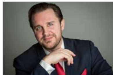
Michael Spyres

Entre sus grabaciones podemos destacar Les martyrs , Le duc d'Albe (Opera Rara), Guillaume Tell , La gazetta , Otello , Le siège de Corinthe (Naxos) y la Petite Messe Solennelle (Naive), Antigono de Mazzoni (Dynamic), Les huguenots (ASO), Faust-Szenen de Schumann (ASO), Otello de Verdi,