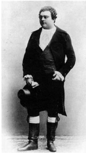
▶ Ernest Van Dyck, el primer Werther