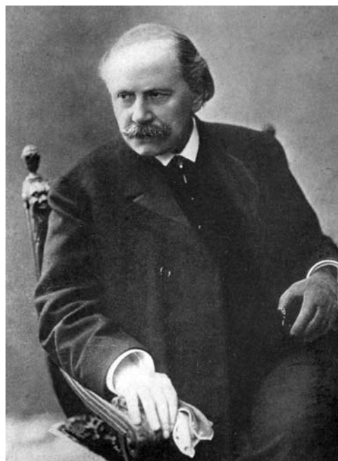
Jules Massenet (1842-1912)

Werther se convirtió en uno de los grandes éxitos del célebre maestro francés. Es relevante el instinto dramático que poseía Massenet; su curiosidad lo llevó a melodramas caballerescos, mitología india, novelas dieciochescas, verismo y por supuesto el romanticismo. Que en 1892 volviera a causar furor operístico un tema escrito por Johann Wolfgang von Goethe, el cual fue publicado como novela en 1774 como Las penas del joven Werther , no sólo se debe a una temática que seguía (y sigue