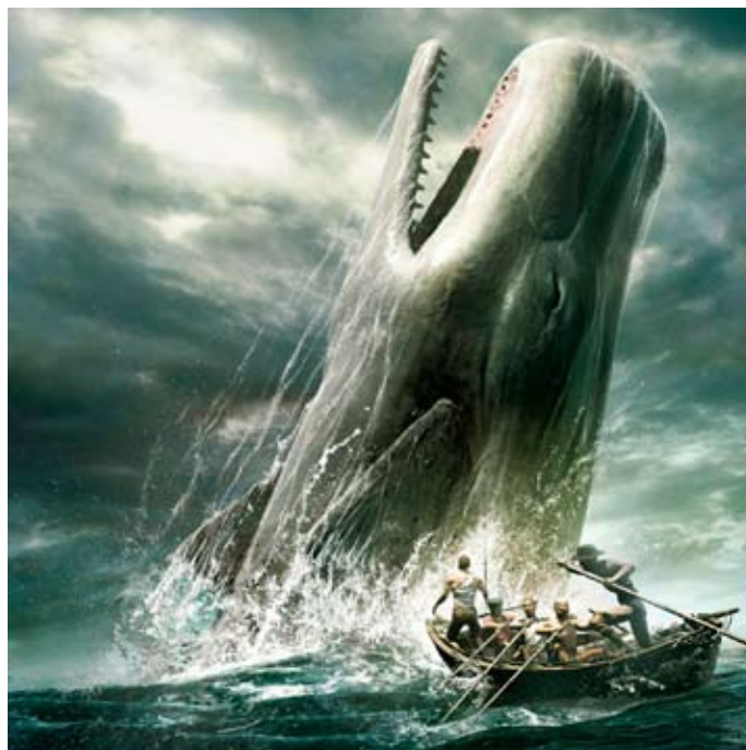
Moby Dick, la ballena blanca

Ahad les habla a los arponeros. Líneas vocales eclécticas (una frase melódica es precedida por otra de construcción atonal). La continuidad radica en la expresión: un crescendo que comienza con determinación, alcanza la iracundia y termina en un brote psicótico en donde Ahab revela el verdadero motivo del viaje: matar a Moby Dick (al pronunciar el nombre del monstruo, la orquesta propone una atmósfera hostil y siniestra), la ballena blanca que le arrancó la