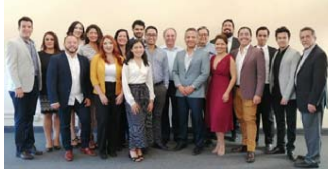
Se creó el Mexico Opera Studio en Monterrey