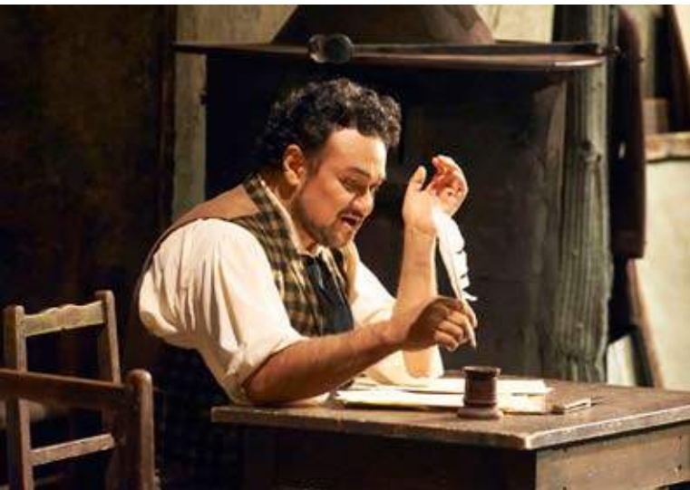
Ramón Vargas cantará La bohème en el Auditorio Nacional