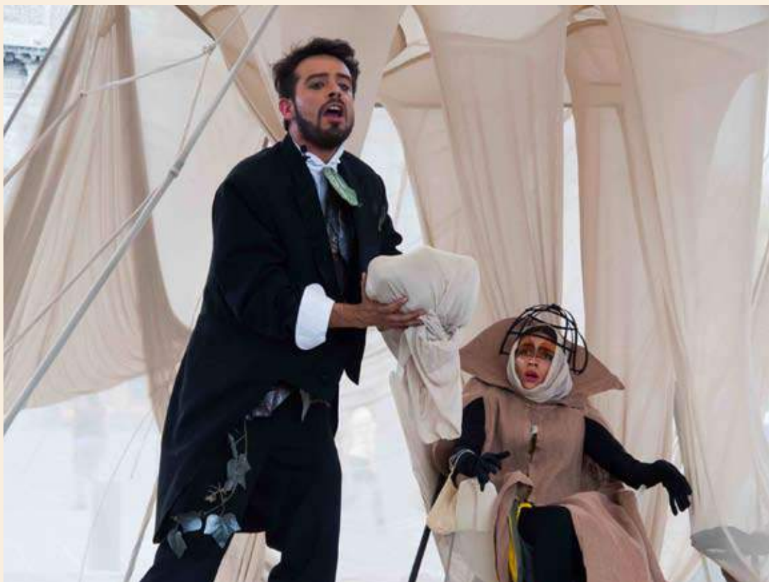
Escena de Apoidea