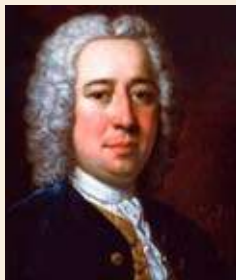
Nicola Porpora (1686-1768)

Aniversario luctuoso de Nicola Porpora (3 de marzo de 1768)