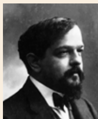
Claude Debussy (1862-1918)

Aniversario luctuoso de Claude Debussy (25 de marzo de 1918)