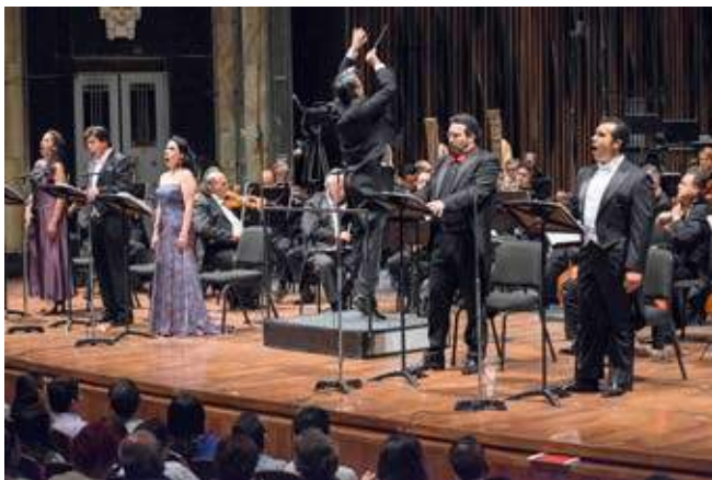
Concertante de Mefistofele en Bellas Artes