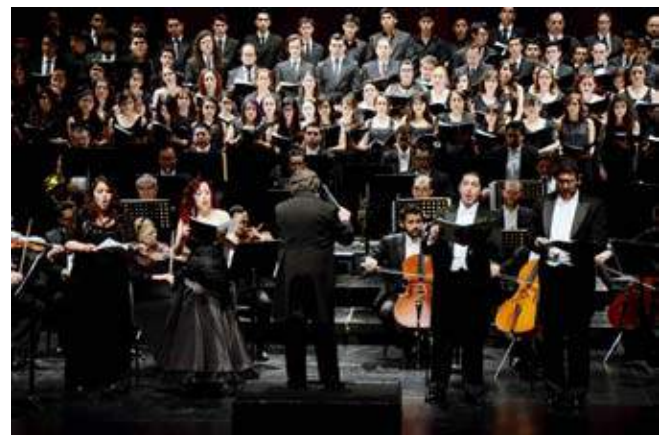
Stabat Mater de Rossini en Torreón

En esta obra monumental del Cisne de Pésaro participaron también los coros del Centro de Estudios Musicales de Torreón, la Escuela Superior de Música de la Universidad Juárez del Estado de Durango (UJED) y la Escuela Municipal de Música Silvestre Revueltas.