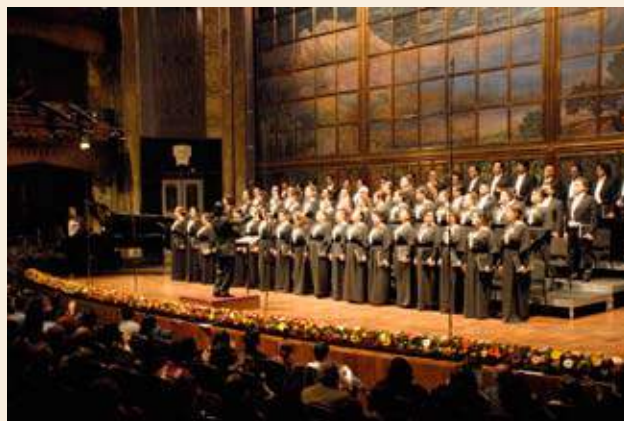
Concierto del 75 aniversario del Coro del Teatro de Bellas Artes

A manera de encore , y después de que el maestro Varela expresó que el concierto fue dedicado a la memoria de Nelson Mandela y de la mezzosoprano mexicana Oralia Domínguez, el Coro entonó el famoso ensamble 'Va' pensiero' de Nabucco de Verdi —que ya había interpretado en la primera parte del programa— y una cálida versión de "Las mañanitas", acompañado por el público, para terminar con 'O Fortuna', el fragmento más conocido de la cantata Carmina Burana de Carl Orff.