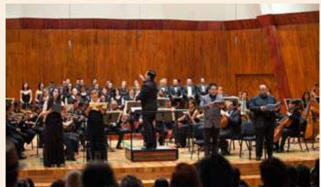
Requiem por Abbado en la Ollin Yoliztli