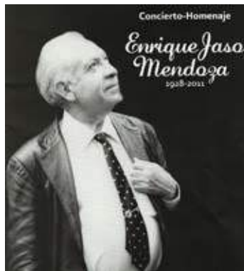
Enrique Jaso, tercer aniversario luctuoso

La primera función tuvo lugar en La Escuela Nacional de Música, en Coyoacán, y la segunda en la Sede del CentrÓpera Enrique Jaso, en Azcapotzalco. Participaron el coro y los solistas de estas academias musicales, bajo la dirección de Maurizio Baldin , el acompañamiento al piano de Israel Barrios Barrera , todos con la dirección general de Miguel Hernández. ●