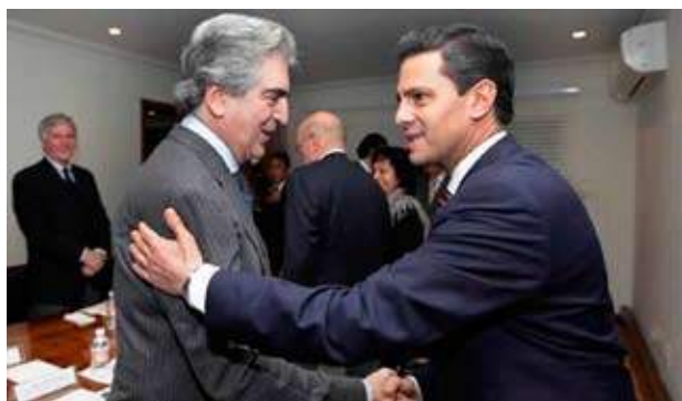
Rafael Tovar y de Teresa y Enrique Peña Nieto, en el 25 aniversario de Conaculta

Durante el evento, el primer mandatario instruyó al Conaculta para la aplicación de acciones culturales en Michoacán, a fin de restituir el tejido social en esa entidad, y anunció el programa “Cultura para la armonía”, que buscará transformar los espacios públicos a través la riqueza artística de nuestro país.