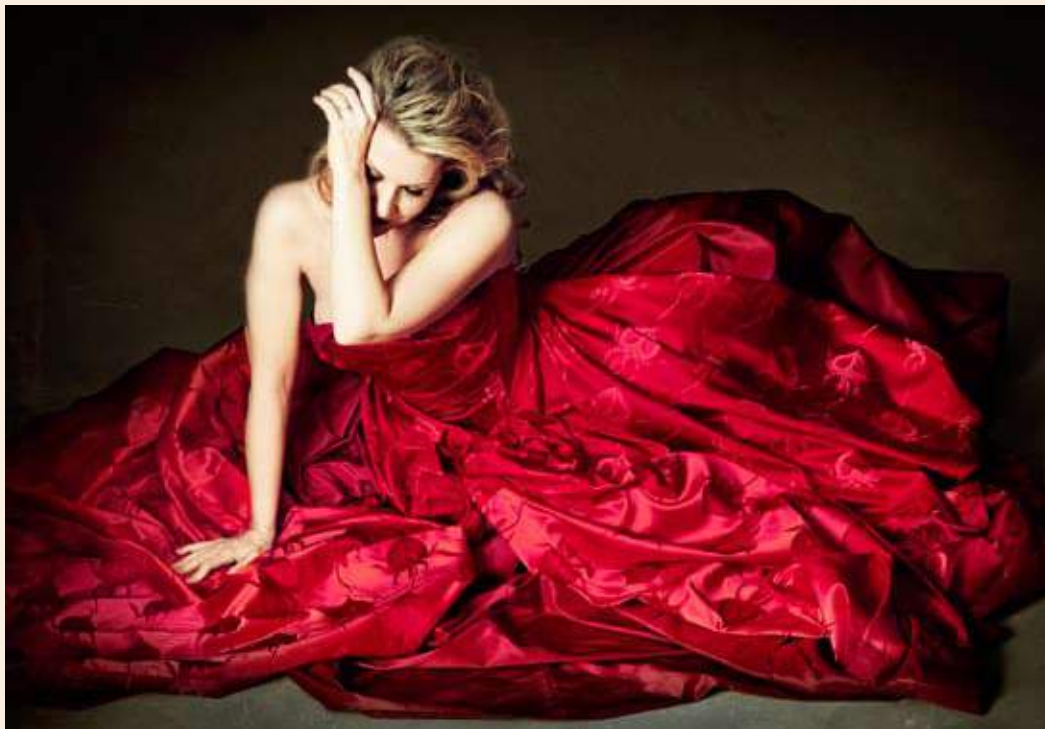
Joyce DiDonato debutó en México con un recital de arias y canciones