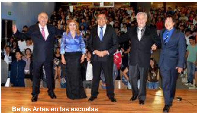
Bellas Artes en las escuelas