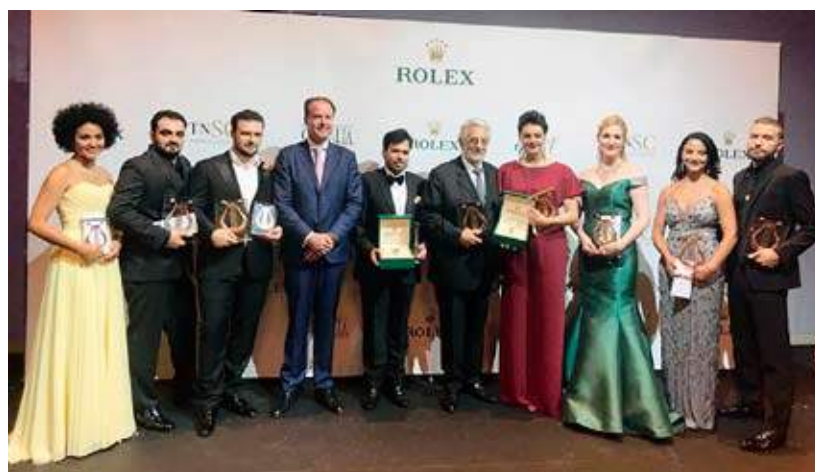
Plácido Domingo, flanqueado por los ganadores de Operalia 2018

Una característica exclusiva de este concurso internacional, el premio de zarzuela Pepita Embil fue para Emily D'Angelo, y el