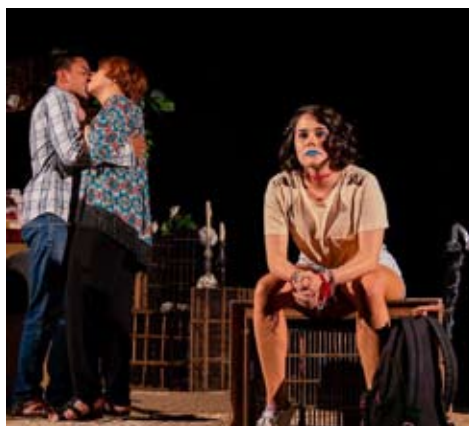
Escena de Los negros pájaros del adiós

El papel de Isabelle se disfruta gracias a la transición que imprime la actriz a su personaje: de la felicidad casi incontrolable del encuentro, hasta el dolor desesperado de la pérdida irremediable. Dorantes da a Gilberto diversas capas histriónicas que hacen comprensible el entramado interior de su personaje. La clase social proveniente, el tono del lenguaje, la edad, el impulso y una cierta baja estima, por ejemplo. Del Real configura una Angélica viva, juvenil, pero madura, que consigue llevar las emociones siempre ahogadas, introvertidas, al filo de las heridas más profundas. ●