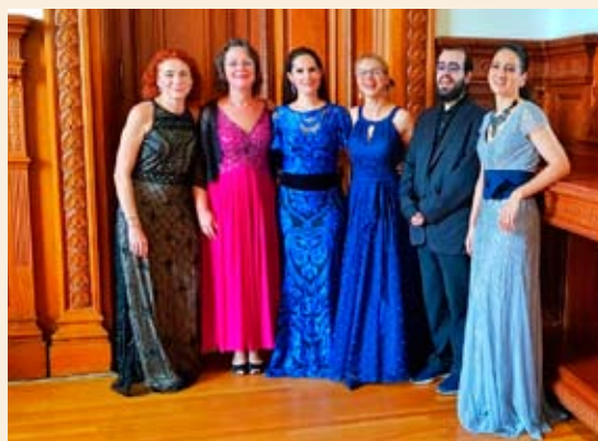
El conjunto, antes del concierto

Cerró el concierto con la composición de Ladrón de Guevara (1990): Cinco canciones para voz y cuarteto de piano, Op. 4 con textos de César Vallejo. Las canciones fueron: 'Los heraldos negros', 'El poeta a su amada', 'VI' (Trilce), 'XIII' (Trilce) y 'LXXVII' (Trilce). Como encore , de la Mora y el Cuarteto Aurora interpretaron una canción más del ciclo de Ladrón de Guevara intitulada 'La araña'.