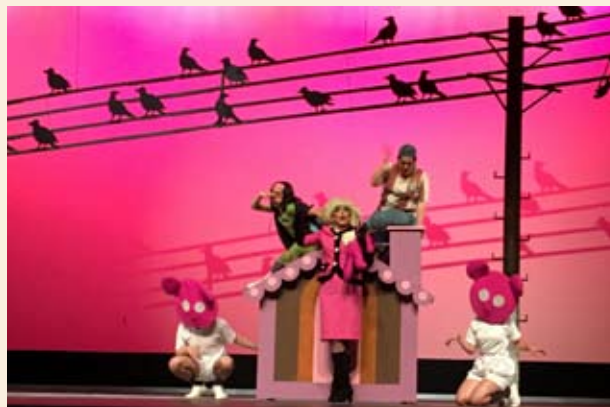
Escena de Hänsel und Gretel en el Teatro de las Artes

La puesta en escena de García Lozano fue divertida, recurrente y actual. Situó la acción en el presente, donde Hansel y Gretel