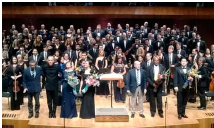
Durante la ovación al final del Requiem de Verdi en la UNAM

Las audiciones para este año 2019 tendrán lugar el 7 de noviembre en San Miguel y se realizará una gala con los ganadores el día 9, nuevamente como preludeo a Nueva Orleans.