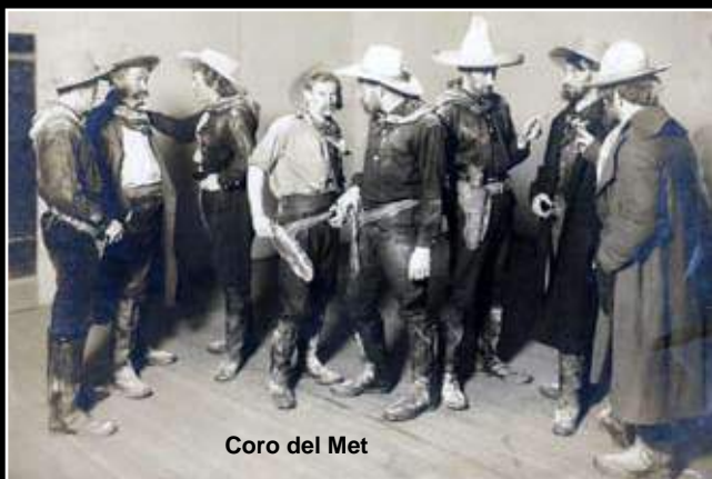
Coro del Met

En relación con el concepto escénico, diré que siempre parto del espacio vacío, porque sólo añadido, paulatinamente, los elementos esenciales para discurrir en términos dramáticos. Evito a