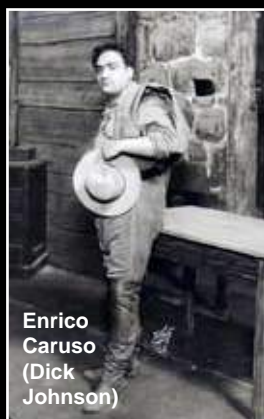
Enrico Caruso (Dick Johnson)