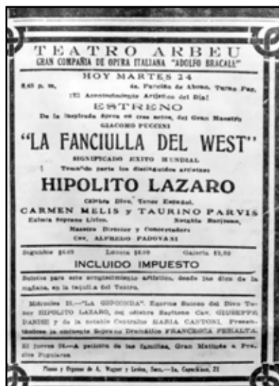
Cartel del estreno en México