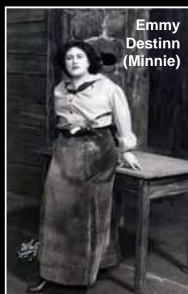
Emmy Destinn (Minnie)

Sí, por supuesto. Todos los personajes están abismados, van al precipicio y son de veras pobres, pero no son homogéneos. Sonora tiene la personalidad más decidida —casi un corifeo— y es quien se enfrenta al antipático y amargado de Jack Rance y quien libera a Ramírez, por poner dos ejemplos clarísimos. Por su parte, Sid ha sido excluido porque reveló su verdadera naturaleza al hacer trampa, y él trata de que lo admitan de nuevo, intentando dar con la pista del bandido (lo dice Nick, un confidente de Minnie que no está enamorado de ella, en el Acto Segundo). Esta comunidad paupérrima queda aún más empobrecida cuando, al final, acepta generosamente perdonar a Ramírez, permitiéndole que se marche