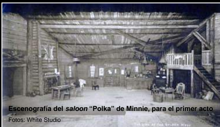
Escenografía del saloon “Polka” de Minnie, para el primer acto