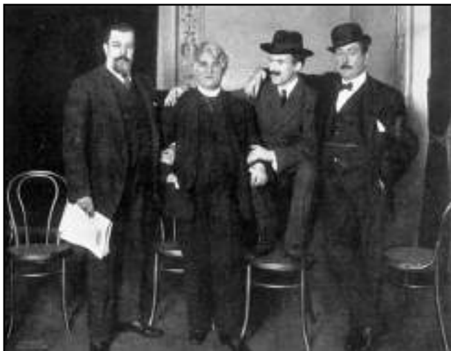
Giulio Gatti-Casazza, David Belasco, Arturo Toscanini y Giacomo Puccini