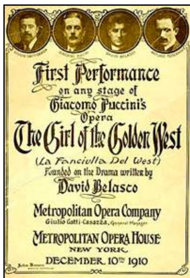
Cartel del estreno en el Met

Me parece muy interesante el personaje de Jack Rance, el sheriff . Es un tahúr amargado pero leal, casado, que dejó a su mujer en la Costa Este, y que está profundamente enamorado de Minnie. Se