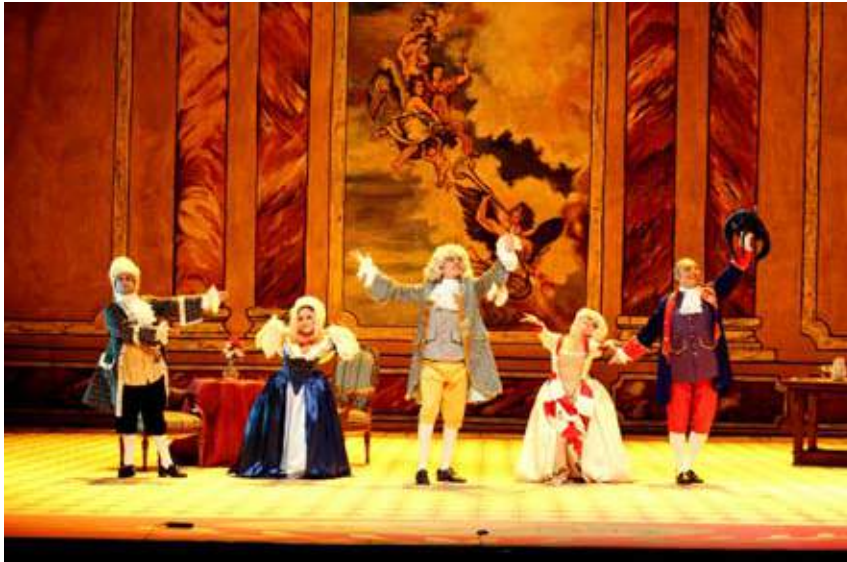
Escena de El Empresario en el Teatro de la Ciudad