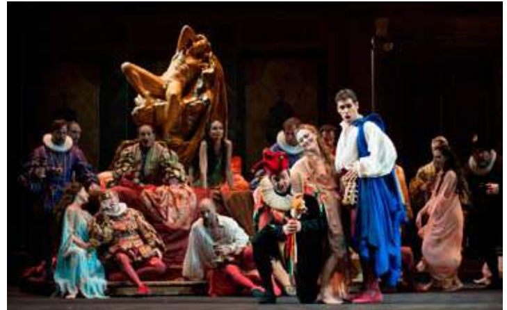
El duque de Rigoletto en Sevilla