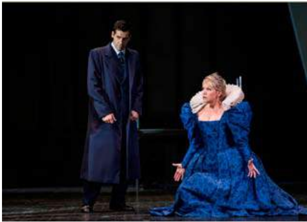
María Estuarda en Londres con Joyce DiDonato

nueve Dos de La hija del regimiento y él decía: “Qué voz más bonita; cante, por favor, ‘Una furtiva lagrima’...”