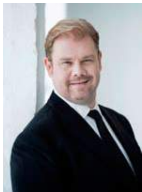
Stuart Skelton

Stuart Skelton es uno de los grandes tenores heroicos de la actualidad. Este cantante australiano se ha especializado en repertorio wagneriano, el cual interpreta con una bella voz abaritonada, elegancia, perfecta dicción en alemán y sin gritar en ningún momento. Canta Wagner sin esfuerzo alguno, matizando y emitiendo un fraseo limpio, sin perder la fuerza dramática o la intensidad vocal. La crítica internacional lo ha nombrado como el mejor Peter Grimes de la actualidad y como un Siegmund que recuerda al gran tenor James King.