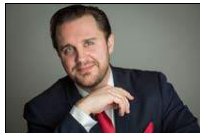
Michael Spyres

Entre sus grabaciones podemos destacar Les martyrs , Le duc d'Albe (Opera Rara), Guillaume Tell , La gazetta , Otello , Le siège de Corinthe (Naxos) y la Petite Messe Solennelle (Naive), Antigono de Mazzoni (Dynamic), Les huguenots (ASO), Faust-Szenen de Schumann (ASO), Otello de Verdi,