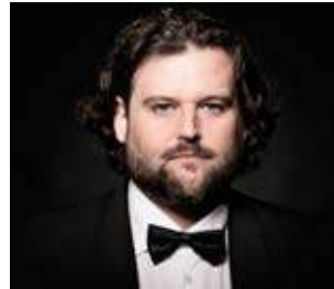
Jean-François Borrás

Este joven tenor francés posee una de las voces más claras y bellas de la escena operística actual. Recuerda mucho a la de su compatriota Alain Vanzo, quien fue uno de los grandes exponentes de la ópera francesa en los años 50 y 60 del siglo pasado. Su emisión es libre, sus agudos son brillantes y su registro central es cálido. Es una voz que se siente de la “vieja escuela”, donde la pureza de la línea y la emisión clara no estaban peleadas con la expresividad.