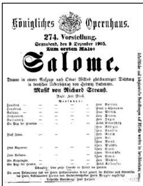
Playbill del estreno de Salome , el 9 diciembre de 1905

Mi ópera favorita de Strauss es, sin duda, Ariadne auf Naxos . La he visto varias veces en su versión revisada, es decir Prólogo y un acto. Sin embargo, hace dos años asistí a una función de la versión original en Salzburgo. Aunque la televisión austriaca grabó varias funciones, no se ha publicado un DVD de la obra. El rumor es que Jonas Kaufmann, Baco, no ha dado su consentimiento. ●