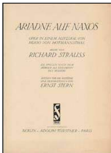
Partitura de Ariadne auf Naxos

En marzo de 1933 llegó al poder Adolf Hitler cuando Strauss tenía 68 años. La relación de