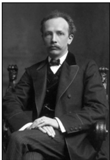
Richard Strauss, joven

El 11 de junio de 1864, es decir hace 150 años, nació Richard Georg Strauss en Múnich. Compositor y director de orquesta cuya larga trayectoria abarca desde el Romanticismo tardío hasta la mitad del siglo XX, es conocido particularmente por sus óperas, poemas sinfónicos y lieder. Strauss, junto con Gustav Mahler, representa el extraordinario florecimiento tardío del Romanticismo germánico después de Richard Wagner, en el cual un desarrollo elaborado y complejo de la orquestación se une a un estilo armónico avanzado. La música de Strauss influyó profundamente en el desarrollo de la música del siglo XX.