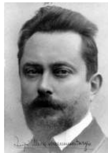
Luigi Illica (1857-1919)

Todavía compuso varias óperas más: Siberia (con libreto de Illica), en 1903; Marcella en 1907; Mese Mariano en 1910; Madame Sans-Gêne en 1915; la opereta Giove a Pompei (en colaboración con Franchetti) en 1921; La cena delle beffe en 1924; e Il re en 1929. Pero ninguna alcanzó la popularidad de las anteriores. ●