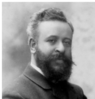
Alberto Franchetti (1860-1942)

La presentación de Cavalleria fue el resultado de una empresa inusual de una figura nada común en el mundo operístico italiano. Se trataba del editor y publicista Edoardo Sonzogno, un amante de la ópera y bon vivant que se había acercado a la escena operística al adquirir los derechos de muchas de las óperas francesas para Italia. En 1883 anunció un concurso para presentar una ópera de un acto de un joven compositor italiano que no se hubiera publicado. Este primer concurso es mejor conocido por haber inexplicablemente desechado la primera ópera de Giacomo Puccini, Le Villi , y otorgar el premio a un trabajo de menor calidad que rápidamente se olvidó.