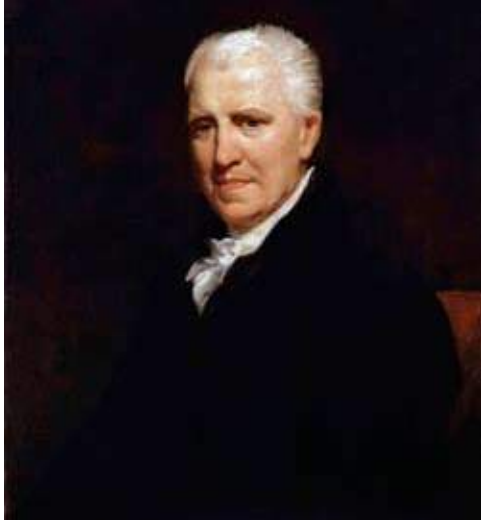
George Crabbe, autor de The Borough , inspiró la ópera de Britten