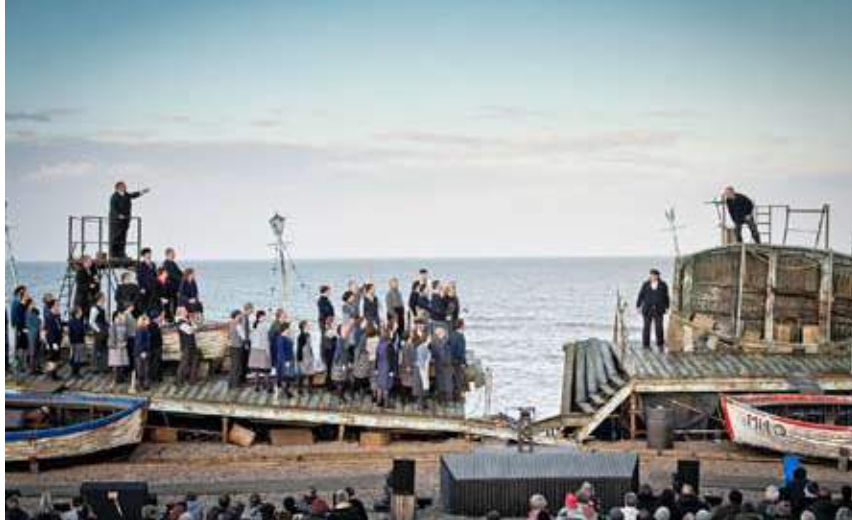
Escena de la puesta en escena de Peter Grimes en la playa de Aldeburgh, 2013

Retrato de Henry William Pickersgill, ca. 1818-1819