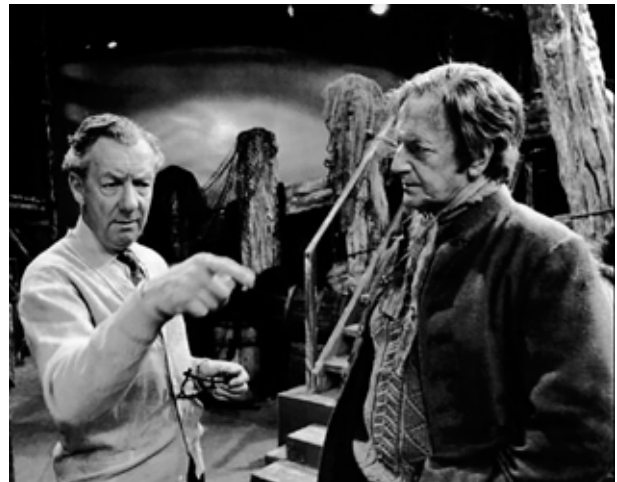
Benjamin Britten y Peter Pears en un ensayo de Peter Grimes , 1969

Se afirma que algunas de las óperas de Britten apuntan a relaciones entre hombres con proyecciones homosexuales, ya que el mismo Britten lo era (su pareja de toda la vida fue el tenor Peter Pears, quien cantó prácticamente en todas las óperas compuestas por aquél). Ese trasfondo sí queda muy claro en la ópera Death in Venice , basada, a su vez, en el inmortal cuento de Thomas Mann.