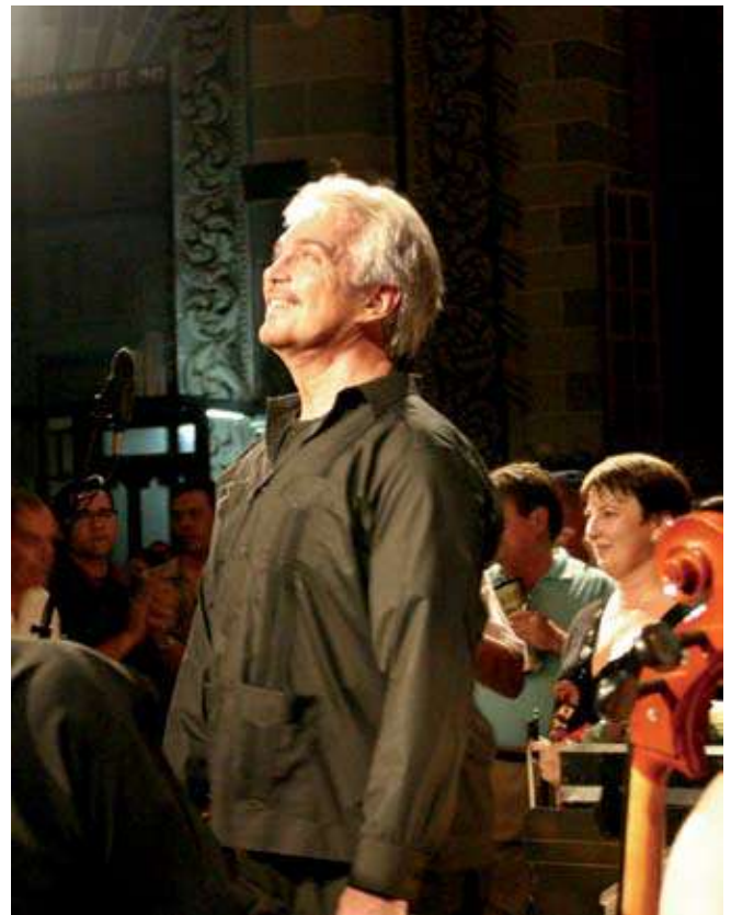
“Le he dado toda mi vida a la ópera”

Eso deseamos. Quisimos que los resultados fueran muy transparentes. Darles gusto a todos es imposible. Todo concurso es difícil en ese sentido y más en uno de ópera, en el que cada quien tiene su posición y gusto muy personal. Pero estamos echándole muchas ganas, y deseamos que cada vez sea más serio y esté mejor organizado para que venga gente de todo el mundo. Queremos que