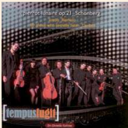
Pierrot Lunaire (Schönberg)

Esta obra (op. 21, estrenada de 1912) es una de las piezas emblemáticas de la música expresionista y atonal del siglo XX. Basada en el ciclo homónimo de poemas en francés del escritor belga Albert Giraud (1860-1929)—un representante menor del movimiento simbolista—, fue traducido al alemán y musicalizado por Arnold Schönberg (1874-1951).