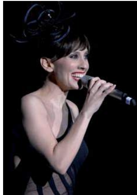
Filippa Giordano cantó en Bellas Artes

No fueron pocos los insultos que en redes sociales se lanzaron contra la cantante siciliana ahora vecindada en Puerto Vallarta, por buena parte de la comunidad lírica mexicana. Incluso la que vive fuera del país. Y no faltó quien aseguró que acudiría a sabotear el concierto, abuchearía a Giordano o le arrojaría tomates en muestra de desaprobación y rechazo.