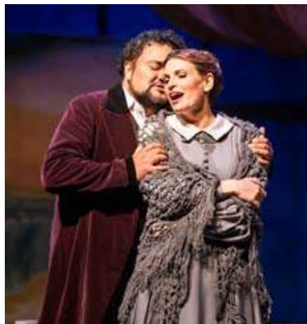
Ramón Vargas (Rodolfo) y Ainhoa Arteta (Mimi) en La bohème