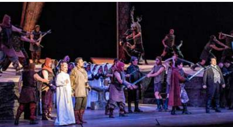
Escena de Il trovatore en Bellas Artes