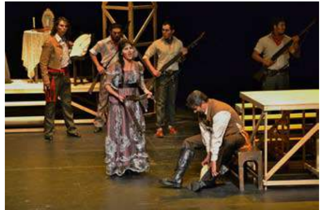
Escena de Anita , de Melesio Morales