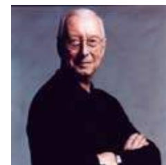
William Christie se presentará con Les Arts Florissants en el Cervantino