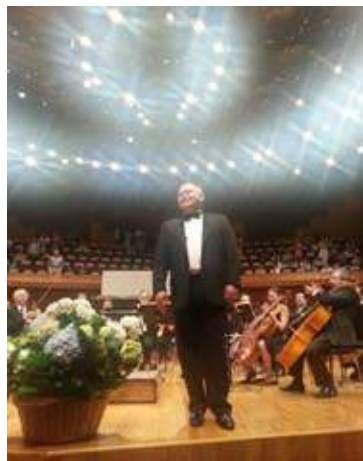
Javier Camarena cantó con la Orquesta Sinfónica de Minería

El programa ofrecido inició con la Trigésima segunda sinfonía de Wolfgang Amadeus Mozart y de este mismo compositor ‘Un’aura amorosa’ de Così fan tutte . Vinieron luego, de Gioachino Rossini la Obertura de Otello y ‘Cessa di più resistere’ de Il barbiere di Siviglia ; de Vincenzo Bellini la Obertura y ‘È serbato, a questo acciaio... L’amo tanto, e m’è sì cara’ de I Capuletti e i Montecchi ; ‘Una furtiva lagrima’ de L’elisir d’amore de Gaetano Donizetti; para cerrar con la Obertura ‘Ah! lève-toi, soleil!’ de Roméo et Juliette de Charles Gounod.