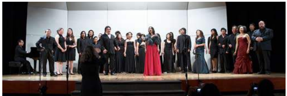
El "Brindis" de La traviata , al final de la primera Gala de ópera realizada en la UDLAP