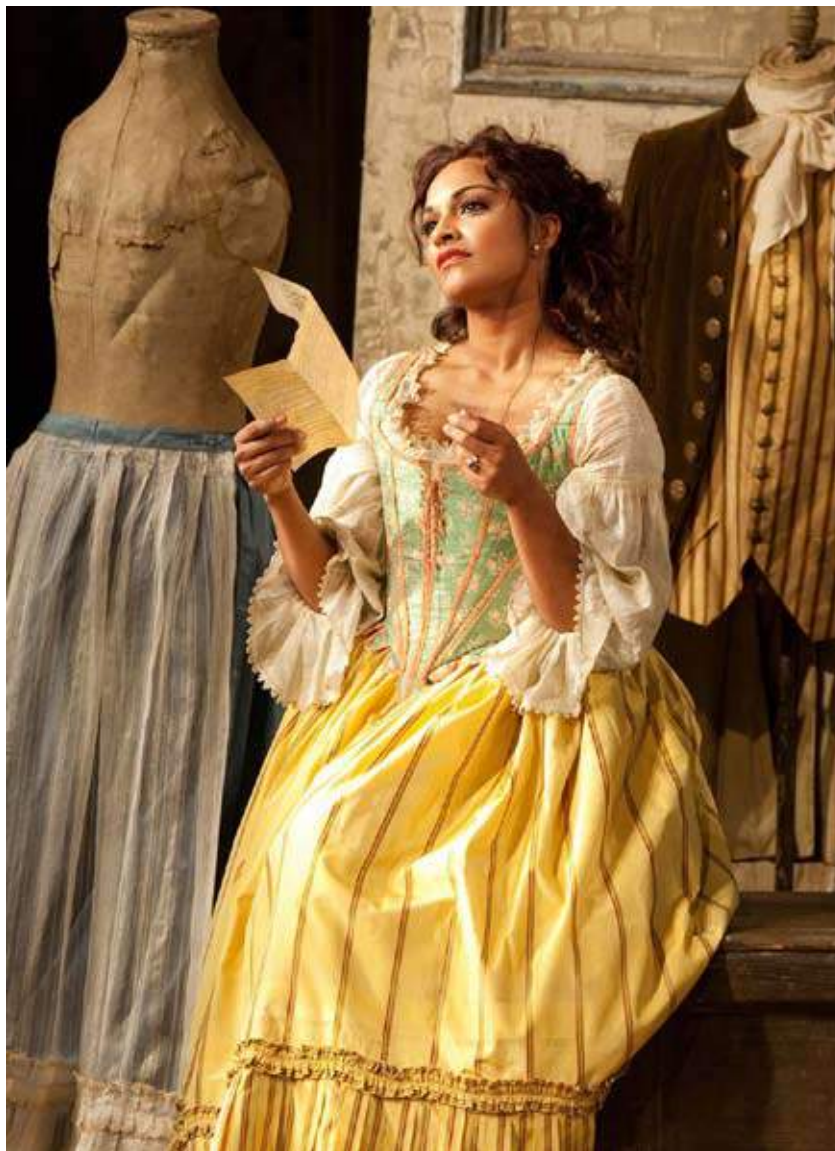
Susanna en Le nozze di Figaro