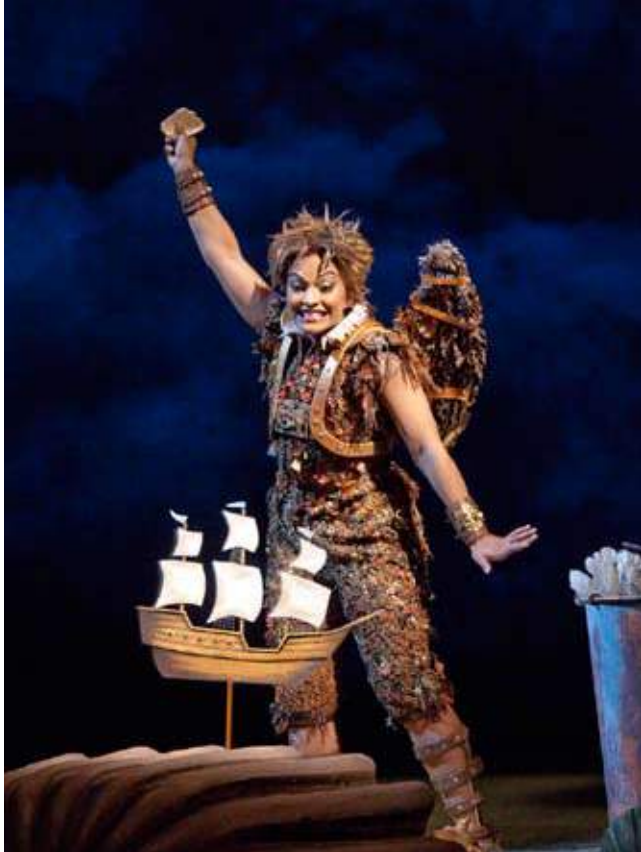
Ariel en The Enchanted Island

Parte del gran éxito de esta soprano australiano-americana es esa espontaneidad y vivacidad en sus interpretaciones; uno nunca verá a Danielle De Niese dando menos del cien por ciento en sus actuaciones. Es una cantante a la que le gusta arriesgarse en escena, sea bailando coreografías complicadas mientras canta o en escenas de gran intensidad y pasión (como cuando interpreta a Poppea). Su voz es clara, con una frescura propia de su juventud; su timbre es aterciopelado, con un centro rico en armónicos y agudos brillantes. Sus grandes ojos almendrados y su radiante sonrisa le han ganado admiradores en todo el mundo, no sólo por su mérito como cantante sino también por su belleza.