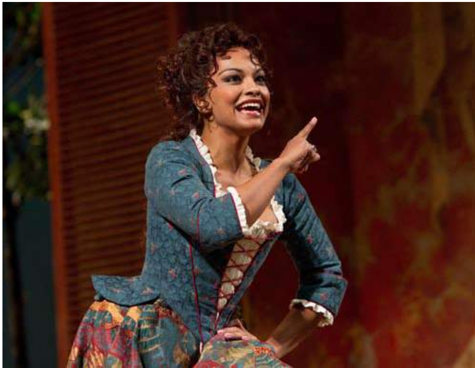
Despina en Così fan tutte

E l pasado mes de abril, durante la segunda función de Giulio Cesare de Händel en el Metropolitan Opera House de Nueva York, la soprano Danielle De Niese suplió de último minuto a su colega, Natalie Dessay, en la producción de David McVicar de dicha obra. La anécdota no tendría nada de sorprendente si no fuese por el hecho de que De Niese estaba como espectadora en el público, disfrutando de una velada en familia con sus padres y su esposo. Le avisaron que Dessay no podía cantar y, en cuestión de unos minutos, De Niese pasó de las butacas del auditorio a los camerinos para probarse los trajes y salir a cantar el rol de Cleopatra en la producción que ella misma estrenó años atrás en Glyndebourne.