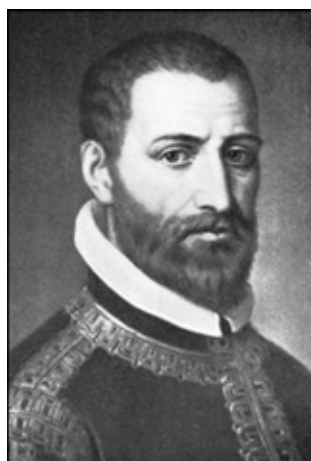
Tomás Luis de Victoria (1548-1611)

Muchos de los escritos de la época refieren a los “naturales” como gente muy receptiva y hábil para las artes, especialmente la música. Esto debido a la larga tradición musical que existía en las poblaciones indígenas, donde al no concebirse diferencias entre teatro, música, canto o danza, dichas expresiones se consideraban un todo indivisible. Esta es una de las razones principales del triunfo del uso de las artes escénicas como forma de evangelización y adoctrinamiento y, por el fervor católico que vivimos todavía en nuestros días, podemos constatar la eficacia de dicha herramienta.