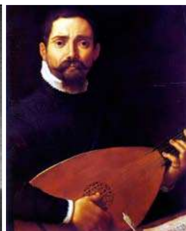
Tomás de Torrejón y Velasco (1644-1728)

La preparación de los músicos de capilla, a lo largo de los tres siglos de la colonia, incluía el canto llano, la música de autores españoles como Tomás Luis de Victoria (1548-1611), pero también de compositores europeos como Franz Joseph Haydn (1732-1809), de quien se puede reconocer una clara influencia en muchos de nuestros compositores novohispanos.