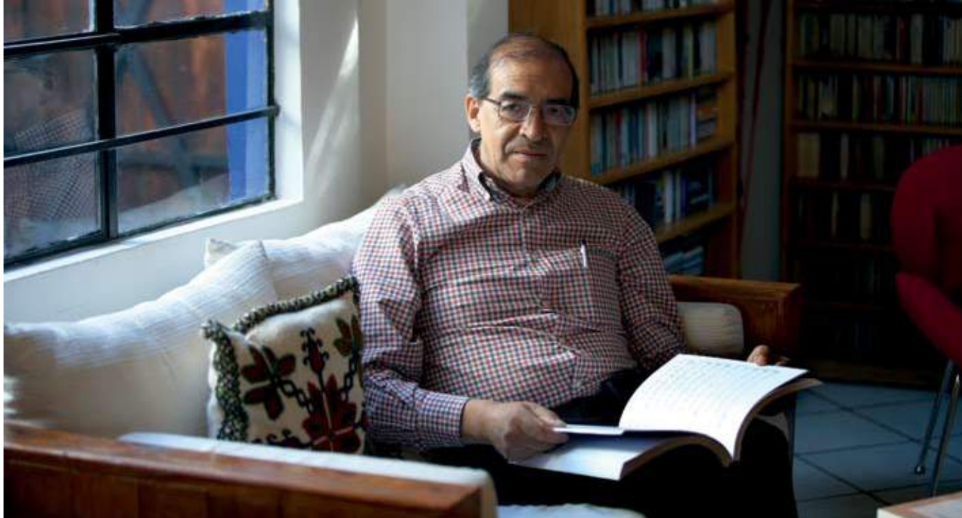
Aurelio Tello: Sumaya era un compositor que estaba “al tanto de las novedades del barroco italianizante”

esplendor terminó sorpresiva y misteriosamente en 1738, cuando Sumaya desapareció de la capilla y junto con él un libro donde se registraba el pago que recibían los músicos por las funciones extras. Durante algún tiempo, nada se supo sobre el paradero de Sumaya. Resultaba insólito, pues luego de más de 20 años de servicio disciplinado se había ido sin solicitar permiso, sin pedir licencia o sin emitir su renuncia.