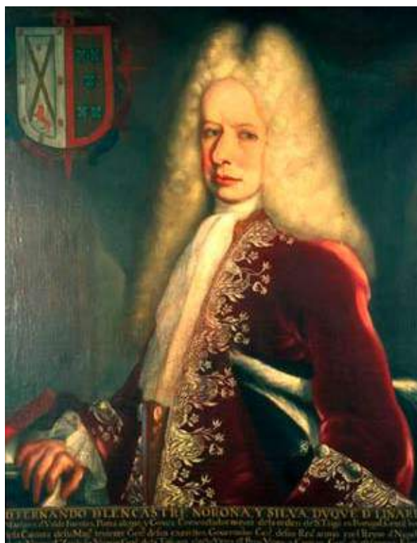
El virrey Fernando de Alencastre Noroña y Silva (que gobernó de 1710 a 1716) comisionó la primera ópera de la Nueva España

Dividido en tres actos y 38 escenas, el argumento involucra a siete personajes cuyas historias se entremezclan en una farsa tradicional con un hilo conductor particularmente confuso: dos princesas curiosas de vivir experiencias amorosas deciden conquistar sendos novios; traman un engaño que implica a una de ellas vestirse de hombre e intrigar entre la aristocracia masculina que frecuenta su castillo. El plan se lleva a cabo y resulta desastroso: un duque, enfurecido por los comentarios insidiosos de la princesa embozada, reta a un duelo, cuya tradición exigía a los combatientes descubrirse el pecho. Al no poder cumplir con este requisito, el falso varón es descubierto y las dos hermanas finalizan la velada bailando con guapos caballeros que las hacen soñar con vidas de amor.