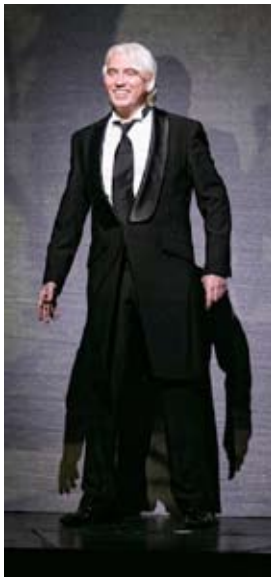
La sorpresa de la noche: Dmitri Hvorostovsky, bajo tratamiento de cáncer cerebral, cantó 'Cortigianni' de Rigoletto