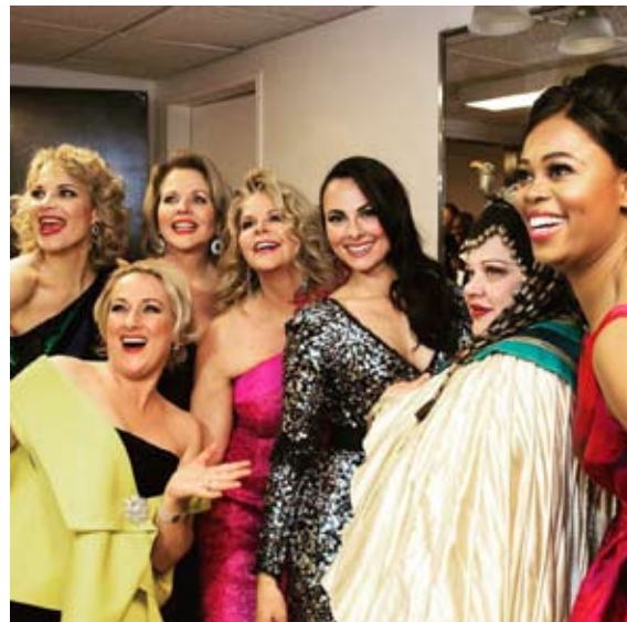
Elīna Garanča, Diana Damrau, Renée Fleming, Susan Graham, Isabel Leonard, Dolores Zajick y Pretty Yende se toman una selfie

A continuación siguieron la mezzosoprano Stephanie Blythe y el contratenor David Daniels como Cornelia y Sesto, respectivamente, cantando el dueto ‘Son nata a lagrimar’ de Giulio Cesare de Händel. Fue el único fragmento de ópera barroca de la gala y ambos cantantes se lucieron en su manera tan bella de cantar este sentido y precioso dueto. El barítono serbio Željko Lučić cantó el aria de Iago ‘Credo in un Dio crudel’ de Otello , ópera que cantó la temporada pasada. Su voz queda muy bien en el repertorio verdiano e imprimió a su aria la maldad necesaria, además