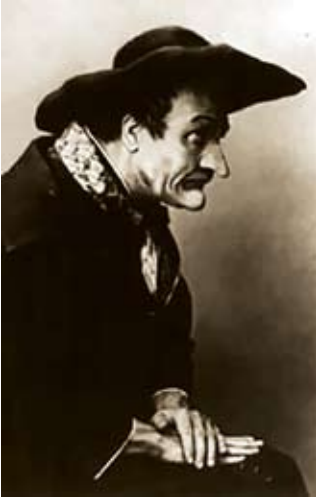
El bajo ruso Feodor Chaliapin como Don Basilio

El calumniado, bajo el azote público: su reputación hecha pedazos. En los siglos XIX y XX importaba muchísimo de cara a la sociedad proteger la imagen pública; el bien jurídico tutelado por la ley era la reputación, el honor, casi podríamos decir a ultranza, a tal grado que proferir una calumnia, una injuria o difamar ¡se castigaba penalmente! [Inclusive los ofendidos solían retarse en duelo para “lavar su honor”. Véase nuestro artículo Cavalleria Rusticana: amor, adulterio y duelo mortal , en Pro Ópera enero-febrero 2011, pág. 48.]