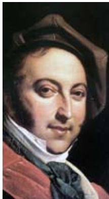
Gioachino Rossini compuso Il barbiere di Siviglia en 1816, cuando contaba con 24 años de edad