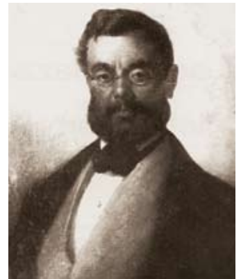
Cesare Sterbini (1784-1831), autor del libretto de El barbero...

La calumnia es un vientecillo, una brisita muy gentil, que imperceptible, sutil, ligeramente, suavemente, comienza a susurrar. Despacio, a ras de tierra, en voz baja, sibilante, va corriendo, va corriendo, va zumbando, va zumbando; en las orejas de la gente se introduce hábilmente y las cabezas y los cerebros, hace aturdir y hace hinchar. Una vez fuera de la boca el alboroto va creciendo, toma fuerza poco a poco vuela ya de un lugar a otro; parece un trueno, una tempestad que en medio del bosque va silbando, atronando, y te hace de horror helar. Al final se desborda y estalla, se propaga, se redobla y produce una explosión, ¡como un disparo de cañón! Un terremoto, un temporal, un tumulto general que hace agitar el aire. Y el infeliz calumniado, envilecido, aplastado, bajo el azote público podrá considerarse afortunado si muere.